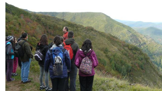
Nunha explicación sobre a Devesa de Rogueira (O Courel)

O máster ten carácter académico profesional pero é un título que facilita o acceso ao doutoramento en educación da USC. Cabe tamén salientar que este título ten a súa propia dinámica investigadora e que os estudantes poden integrarse en equipos xa constituídos para a realización de teses. Este master mantén un programa de intercambio Erasmus coa Philipps-Universität de Marburg (Alemaña)