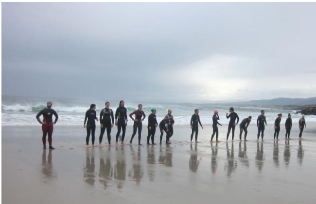
Prácticas de salvamento e deporte acuático en Foz

Características dos estudantes aos que vai dirixido o curso: É un máster oficial especialmente deseñado para graduados ou diplomados nos distintos títulos de educación (Mestre, Educación Social, Pedagogía, Psicopedagogía), e tamén moi adecuado para licenciados/graduados en Bioloxía, Xeoloxía, Xeografía ou Ciencias da Actividade Física e Deporte, así como para outros títulos relacionados cos contornos naturais como as titulacións agroforestais. A pesar de que ningún título está excluído, para iniciar estes estudos, como perfil de ingreso, é recomendable ter algunha experiencia en asociacionismo xuvenil, campismo, coñecemento da natureza, deportes de montaña, excursionismo, capacidade narrativa e de descrición de paisaxes, nocións de seguridade en actividades ao aire libre, habilidades para o traballo cooperativo, optimismo, boa forma física e coñecemento de idiomas. Como tal máster oficial o título é válido en todos os países da Unión Europea.