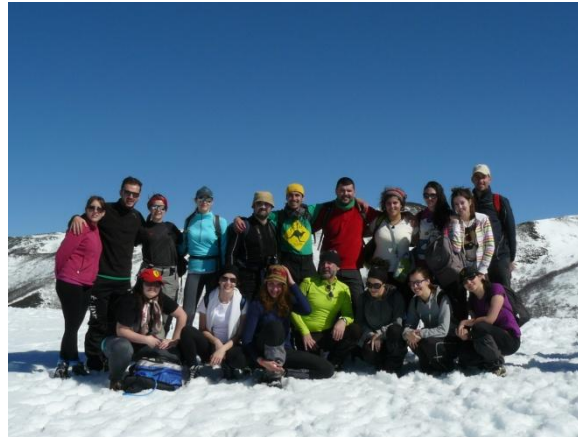
No camiño ao cumio de Tres Bispos (Os Ancares)

Preinscrición: entre o 7 de xullo e o 7 de agosto Adxudicación de prazas: 11 de agosto. Matriculación xeral: ata o 3 de setembro. Prazas (lista de agarda): 12-22 de agosto. Prazo matrícula vacantes: 4-17 de setembro. Comezo do curso: 25 de setembro de 2015. Remate da fase teórica: 29 de marzo de 2016. Prácticum: 1 de abril ao 25 de maio de 2016. Presentación de TFM's: 27 de xuño de 2016.